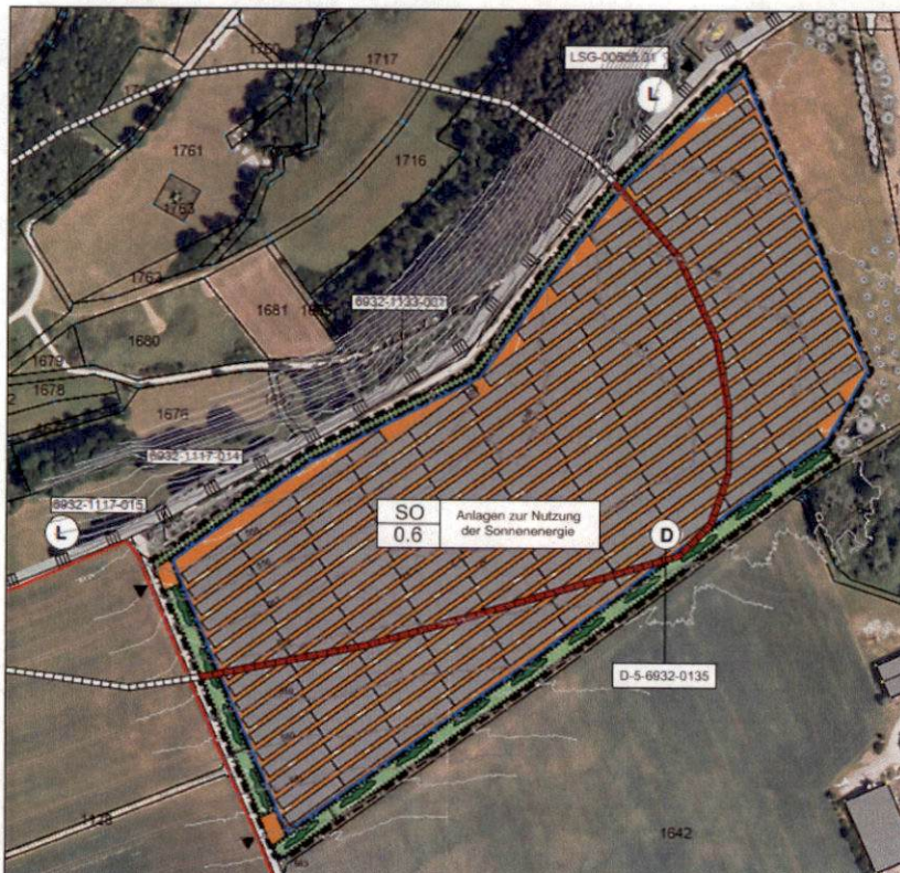
Auszug aus dem Vorentwurf zum Bebauungsplan Nr. 14.2 „Freiflächenphotovoltaikanlage Nennslingen West – neu“ © Kartengrundlage: Bayerische Vermessungsverwaltung