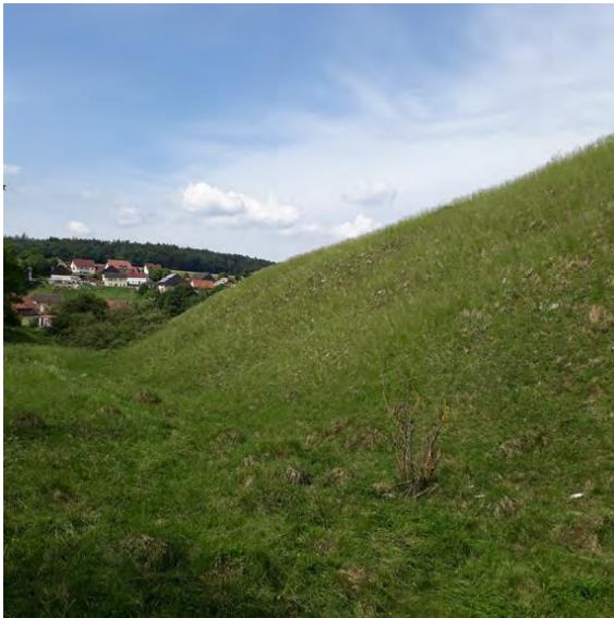
Blick aus östlicher Richtung über die Hutung hinweg auf Bechthal. Aufnahme von 2018.