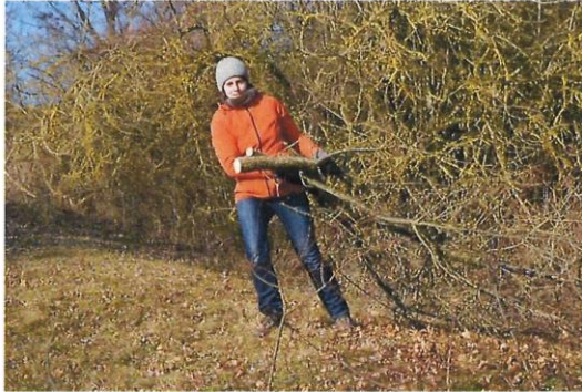
Gehölzpflege einer verbuschten Schafhütung