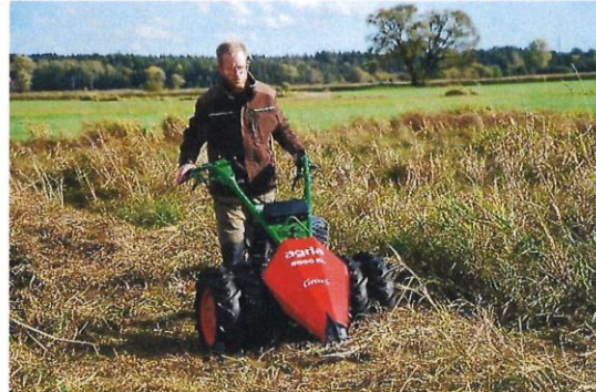
Pflege einer Nasswiese, teils in Handarbeit, teils maschinell unterstützt

Anpacken und mitmachen heißt die Devise, wenn der Landschaftspflegeverband Mittelfranken von Juli 2022 bis Januar 2023 zu einer 6-tägigen Fortbildung in Sachen Landschaftspflege einlädt. Wer wissen möchte, wie man zum Erhalt unserer wertvollen und einzigartigen Landschaft aktiv beitragen kann, ist hier richtig. Ganz konkret lernen die Teilnehmer/-innen einen Magerrasen von Sträuchern und Büschen zu befreien, damit der Schäfer wieder beweiden kann, Hecken fachgerecht zu pflegen und Feuchtwiesen so zu mähen, dass der Lebensraum von Orchideen und Schmetterlingen erhalten bleibt. Streuobstwiesen, Hecken und Bäume werden gepflanzt sowie der Umgang mit den entsprechenden Maschinen und Gerätschaften erprobt. Auch Arbeitssicherheit und steuerliche Aspekte einer Erwerbstätigkeit in der Landschaftspflege sind Inhalte der Weiterbildung. Neben der Vermittlung theoretischer Hintergründe und Aspekte liegt der Schwerpunkt dabei auf der praktischen und angewandten Landschaftspflege, die anschließend zum Einsatz im Gelände befähigt.