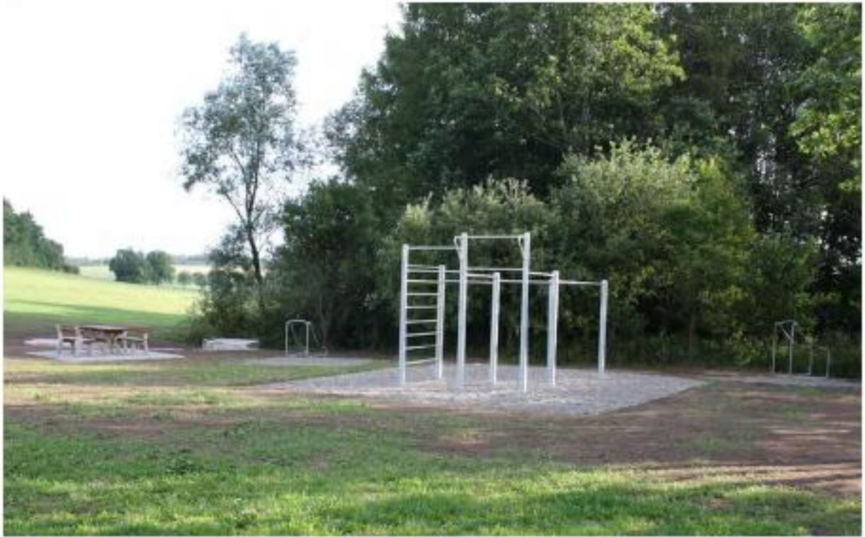
Hirschspring, Quelle für den Hirschgraben, Aufnahme: 2019, Lage: im Westen von Nennslingen, von der Pfraunfelder Straße aus zu erreichen!