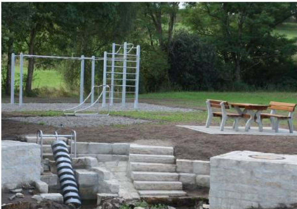
Hirschspring, Aufnahme: 2019, Quelle für den Hirschgraben, Lage: im Westen von Nennslingen, von der Pfraunfelder Straße aus zu erreichen!